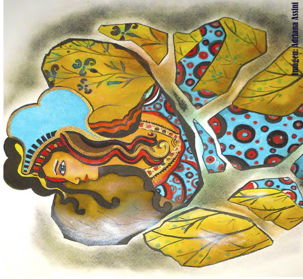
Imagem: Adriana Assini